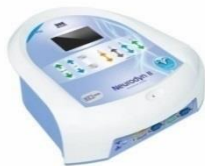
Neurodyn II - Corrente Tens, Fes e Russa - 04 Canais