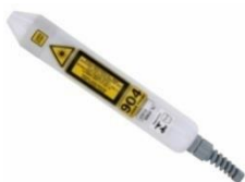
Caneta 904nm - Laser Infravermelho para Laserpulse