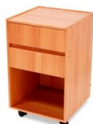
Mesa Auxiliar com 2 Gavetas e 1 Prateleira em Madeira –