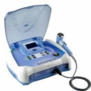
Sonopulse - Ultrassom de 1 e 3Mhz