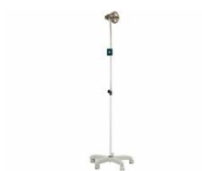
Suporte para Lâmpada Infravermelho –