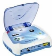
Laserpulse - Laserterapia, Laseracupuntura e Cicatrização